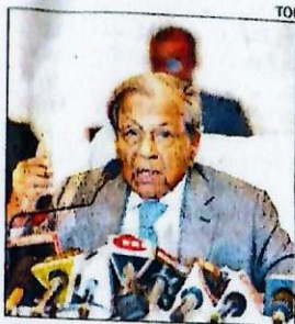
Chairman of 15th Finance Commission, N K Singh, speaks to media in Bhubaneswar

He also appreciated Odisha's overall financial manage-