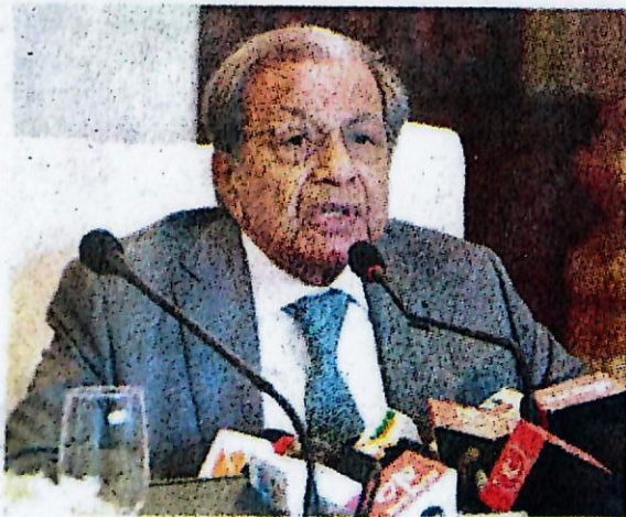
।।ପ୍ରଭାନ୍ୟୁଜ୍।। ଭୁବନେଶ୍ୱର, ୯।୧:

ଗରିବୀ ଓ କମ୍ ମୁଣ୍ଡପିଛା ଆୟ ଭଳି ଆହୁାନ ସତ୍ତ୍ୱେ ରାଜନୈତିକ ସ୍ଥିରତା ଓ ଅନ୍ୟ କାରକଗୁଡ଼ିକ ଓଡ଼ିଶା ପାଇଁ ସୁଯୋଗ ସୃଷ୍ଟି କରିଛି । ସେହିପରି ରଣ ଛାଡ଼ର ବିକଳ ଭାବେ ‘କାଳିଆ’ ଯୋଜନା ଏକ ଭଲ ପଦକ୍ଷେପ । ସଠିକ୍ ହିତାଧିକାରୀଙ୍କୁ ଚୟନ କରି ଯୋଜନାର ସୁଫଳ ପହଞ୍ଚାଇ ପାରିଲେ ଚାଷୀଙ୍କ ବିକାଶ ହୋଇପାରିବ । ପଂଚଦଶ ଅର୍ଥ