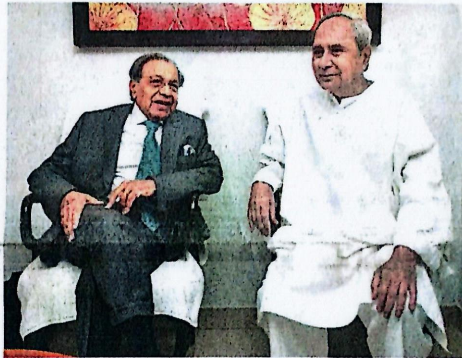
Chief Minister Naveen Patnaik with Finance Commission Charman N K Singh in Bhubaneswar on Wednesday | EXPRESS

The State Government submitted a memorandum seeking a special package to Odisha and increasing sharing