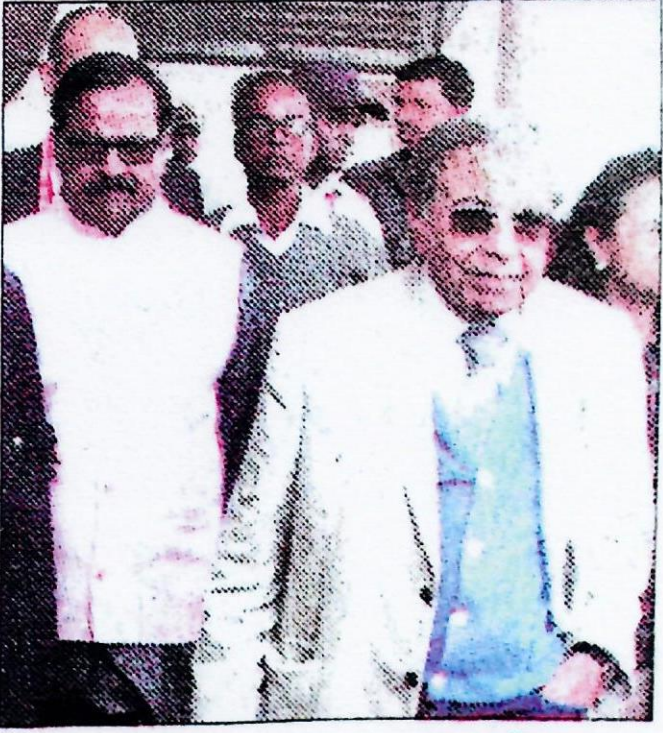
ଭୁବନେଶ୍ୱର ବିମାନ ବନ୍ଦରରୁ ବାହାରୁଛନ୍ତି ପଞ୍ଚଦଶ ଅର୍ଥ କମିଶନ ଅଧ୍ୟକ୍ଷ ନନ୍ଦକିଶୋର ସିଂ (ତାହାଣ) ।

'ଦେଶର ଆର୍ଥିକ ବିକାଶ ପାଇଁ ଓଡ଼ିଶାରେ ପର୍ଯ୍ୟାପ୍ତ ସୁଯୋଗ ରହିଛି'