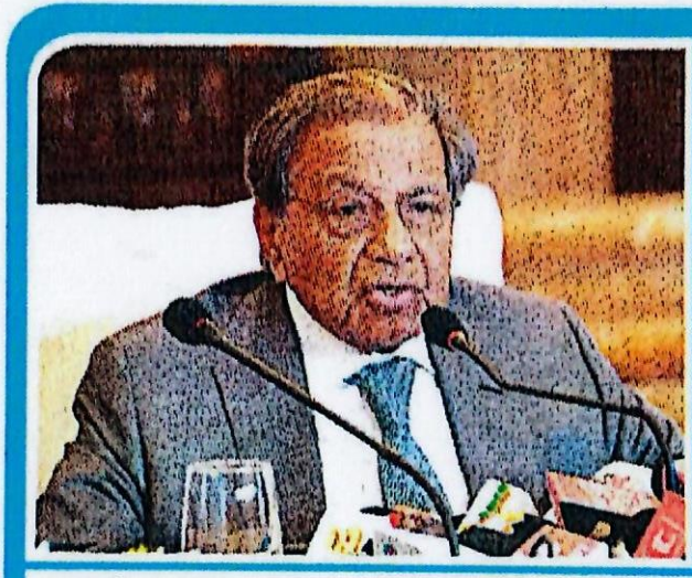
ଅର୍ଥ ଆୟୋଗ ଅଧ୍ୟକ୍ଷ ନନ୍ଦ କିଶୋର ସିଂହ

ଭୁବନେଶ୍ୱର, ୯/୧(ଇମିସ): ନିର୍ବାଚନ ବର୍ଷରେ ରାଜ୍ୟ ସରକାରଙ୍କୁ ପଞ୍ଚଦଶ ଅର୍ଥ ଆୟୋଗ ବଡ଼ ସାଟିଫିକେଟ ଧରାଇଛନ୍ତି। ଓଡ଼ିଶା ଅର୍ଥନୀତିର ସମୀକ୍ଷା କରିବା ପରେ ଆୟୋଗ ଅଧ୍ୟକ୍ଷ ନନ୍ଦ କିଶୋର ସିଂହ ଓ ଅନ୍ୟ ସଦସ୍ୟମାନେ ଆଜି ମୁଖ୍ୟମନ୍ତ୍ରୀ ନବୀନ ପଟ୍ଟନାୟକ ଓ ରାଜ୍ୟ ସରକାରଙ୍କୁ ପ୍ରଶଂସା କରିଛନ୍ତି। କହିଛନ୍ତି, ନବୀନଙ୍କ ନେତୃତ୍ୱରେ ଚାଲିଥିବା ସ୍ଥିର ସରକାର ରାଜ୍ୟରେ ଦାରିଦ୍ର୍ୟ ଦୂରୀକରଣ କ୍ଷେତ୍ରରେ ଉଲ୍ଲେଖନୀୟ କାର୍ଯ୍ୟ କରିଛନ୍ତି। ମୁଣ୍ଡପିଛା ଆୟ ବୃଦ୍ଧିରେ ମଧ୍ୟ ଯଥେଷ୍ଟ ଅଗ୍ରଗତି କରିଛି ଓଡ଼ିଶା। ସ୍ୱାସ୍ଥ୍ୟ ସୂଚକାଙ୍କ କ୍ଷେତ୍ରରେ ବି ଯଥେଷ୍ଟ ଅଗ୍ରଗତି ହୋଇଛି। ସବୁଠାରୁ ବଡ଼ କଥା ହେଉଛି, ରାଜ୍ୟ ସରକାରଙ୍କ ଯେଉଁ କାର୍ଯ୍ୟକ୍ରମକୁ ନେଇ ବିରୋଧୀ ଶାଣିତ ଆକ୍ରମଣ କରୁଛନ୍ତି, କୃଷି ଓ କୃଷକଙ୍କ ବିକାଶ ପାଇଁ ରାଜ୍ୟ ସରକାର ଆରମ୍ଭ କରିଥିବା ସେହି 'କାଳିଆ' ଏକ ଉତ୍ତମ ଯୋଜନା ବୋଲି ଆୟୋଗର ଅଧ୍ୟକ୍ଷ ଓ ଅନ୍ୟ ସଦସ୍ୟମାନେ ମତ ଦେଇଛନ୍ତି। କହିଛନ୍ତି,